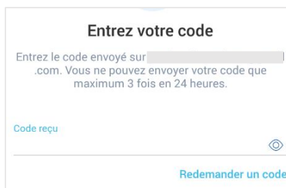
Figure 3 - Introduire son code à usage unique (OTP)

En soumettant votre identifiant ou votre n° de téléphone, vous recevrez un code à usage unique, soit dans votre boîte mail ou sur votre portable (SMS).