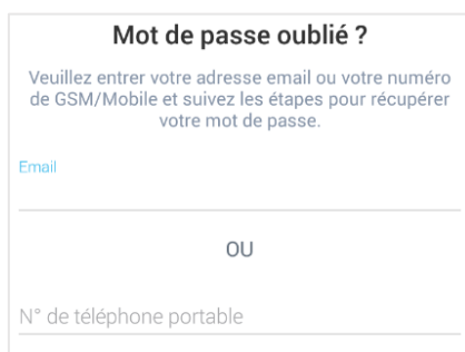
Figure 2 – Choix de réception du code

On vous demandera de fournir soit votre identifiant email (vous recevrez un email) soit votre n° de portable (vous recevrez un SMS à condition que le numéro soit enregistré dans ZippSlip).